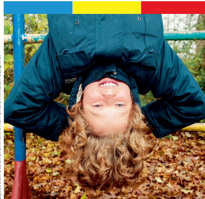
Layout: blum DESIGN&KOMMUNIKATION GmbH, www.blum-design.net